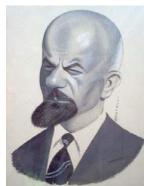
Caricatura di Tullio Colsalvatico

Hanno concesso patrocinio e/o contributo: