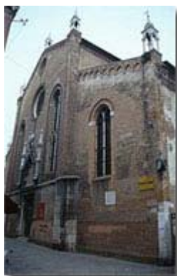
Santo Stefano - Venezia